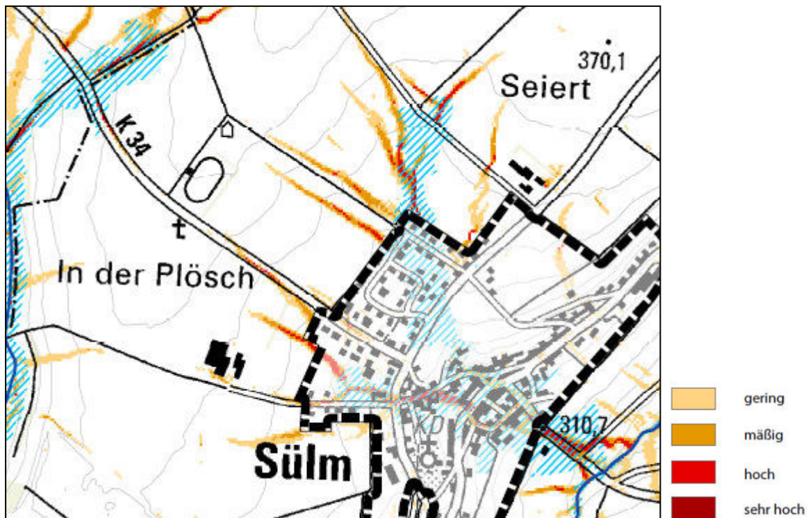
Abb. 2: Sturzflutentstehungsgebiet - Abflusskonzentration

Im Flachland werden die Klassengrenzen der Einzugsgebietsgröße in Anpassung an die geringeren Fließgeschwindigkeiten bei sehr geringen Hangneigungen verschoben: